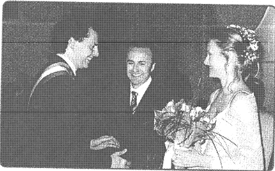
Sposi davanti al sindaco

Il matrimonio civile è un altro tipo di matrimonio dove gli sposi compaiono davanti al sindaco, che legge gli articoli del codice civile.