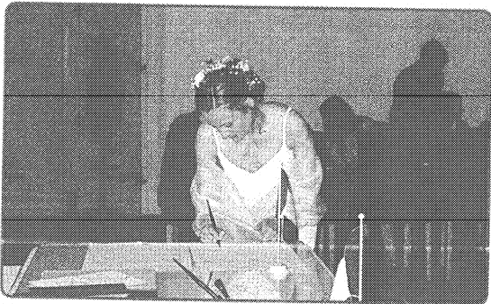
Firma del contratto di matrimonio